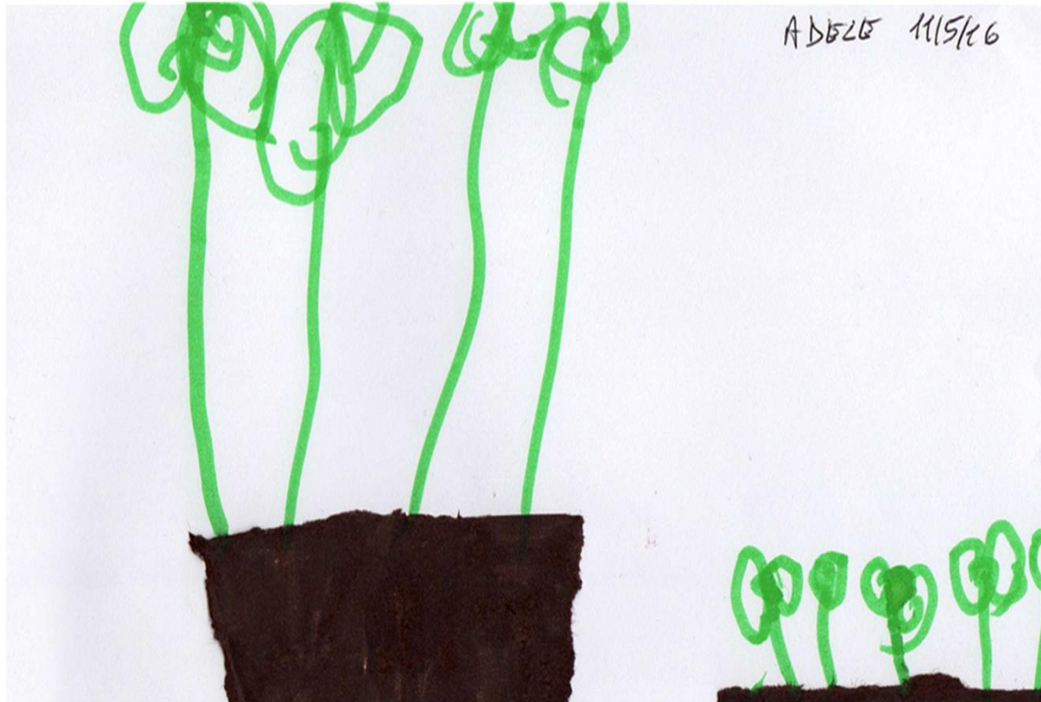
DISEGNO LE PIANTE DELLA MALVA E DELLA CAMOMILLA